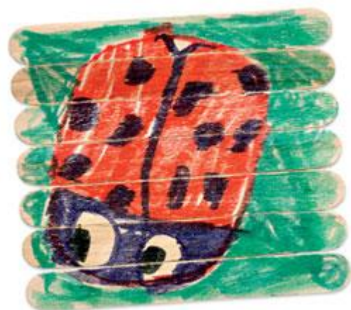
Rompecabeza hecho con palitos de helado