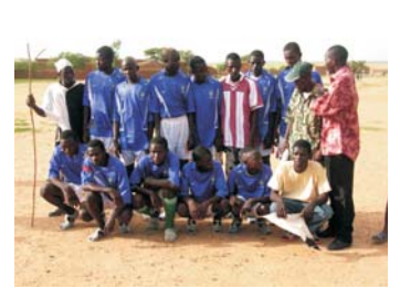
Equipos de fútbol