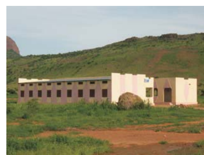
Nueva escuela "Juan González Salmerón" de Garmi