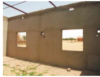
Escuela Taller de Hombori - Aula