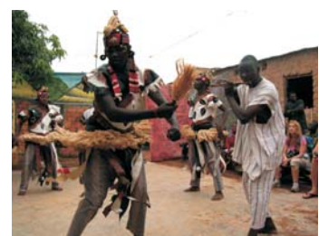
Ensemble Culturel Kiswend Sida