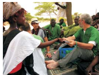
Apoyo Soutrey Konda