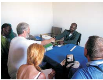
Protocolos de acuerdo con autoridades