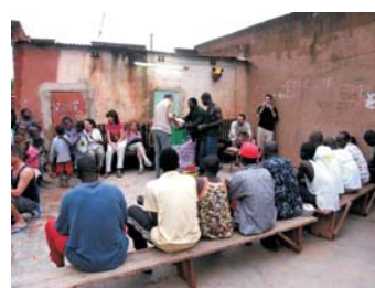
Ensemble Culturel Kiswend Sida