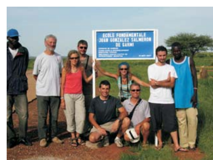
Cartel escuela en la carretera