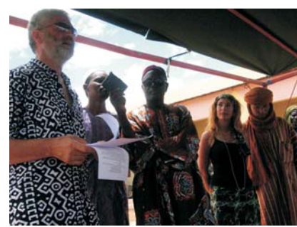
Inauguración nueva escuela