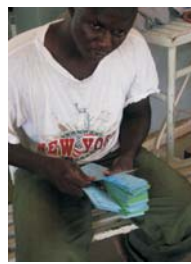
Hospital de Hombori / Mutua médica