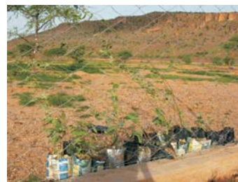
Reforestación Soutrey Konda