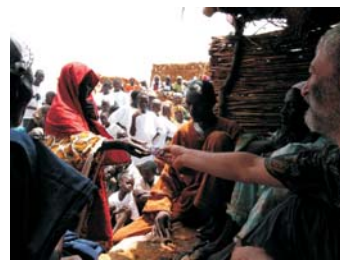
Devolución micro créditos mujeres (Goilel)