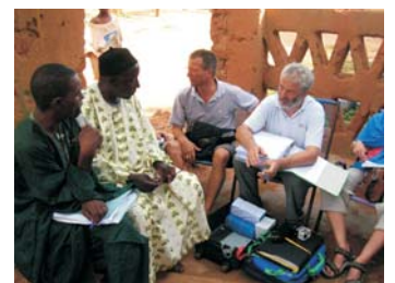
GADEV - Contraparte en Mali