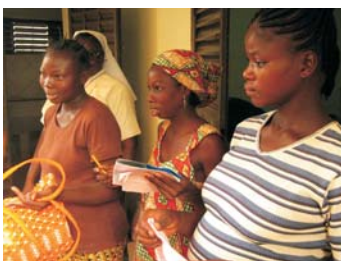
Mujeres proyecto CARMEN