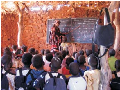
Antigua escuela de Garmi