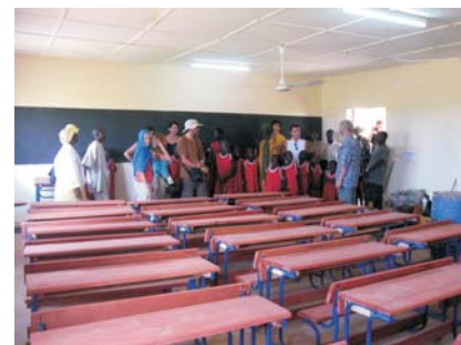
Aula nueva escuela