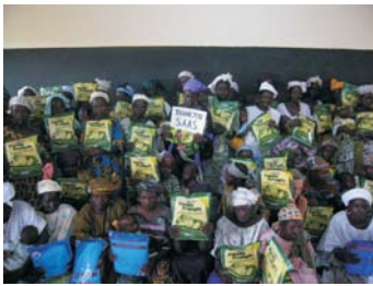
Entrega de mosquiteras