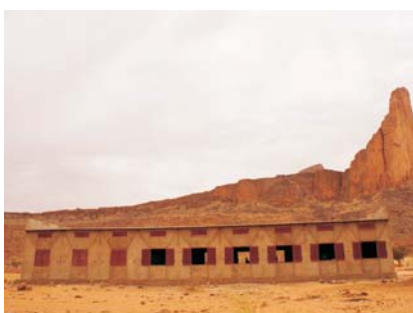
Nueva escuela en construcción