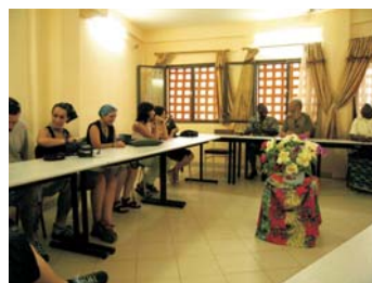
Reunión proyecto CARMEN