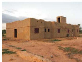
Campamento "Mousa Maiga Costo"