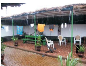
Albergue Constance - Arsene