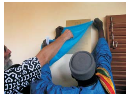
Inauguración nueva escuela