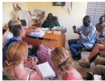
Relaciones con el Ayuntamiento