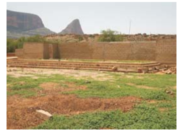
Escuela Taller de Hombori - Escenario