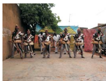
Ensemble Culturel Kiswend Sida