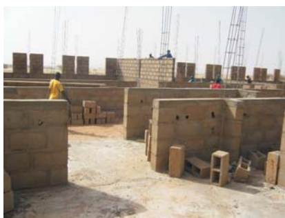
Nueva escuela en construcción