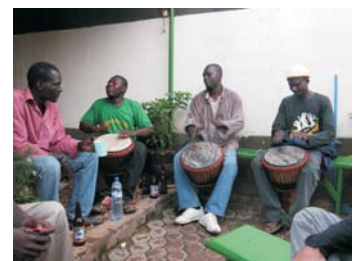
Albergue Constance - Arsene