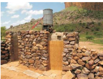
Campamento Mano de Fatima