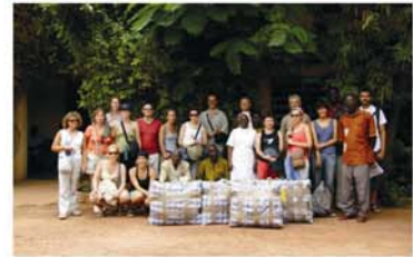
6 Grupo Agosto