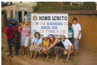
7 Grupo Septiembre