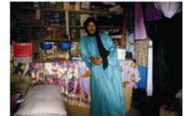
Colaboración con la Asociación Ajikke (Asociación de Mujeres) de Hombori