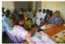
Protocolos de acuerdo con las autoridades y asociaciones de la Comuna de Hombori