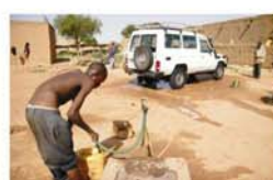
Caravana de vehículos a África