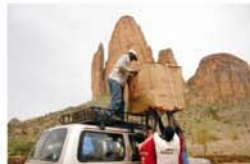
Campañas de prevención del SIDA en la Comuna de Hombori