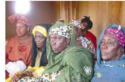
Colaboración con la Asociación de Comerciantes de la Comuna de Hombori