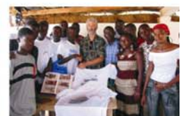
Ensemble Cultural Kiswend SIDA (Ouagadougou)