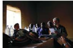
Apoyo a la Asociación Soutrei Konda de la Comuna de Hombori