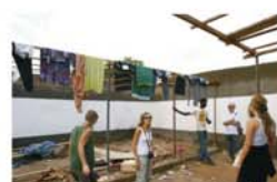
Micro créditos concedidos a hombres