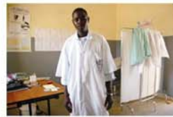
Relaciones con el ayuntamiento y con la Subprefectura de la Comuna de Hombori